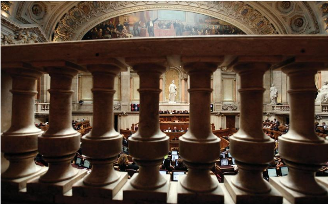
O debate no Parlamento arranca esta quarta-feira, com a discussão sobre as alterações aos estatutos de quatro associações profissionais.

CATARINA ALMEIRA PEREIRA catarinapereira@negocios.pt RUI PERES JORGE rpjorge@negocios.pt