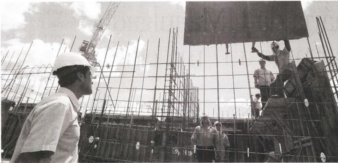
Há mil engenheiros inscritos na Ordem na Madeira. Os de Engenharia Civil são os que mais têm sentido o desemprego.