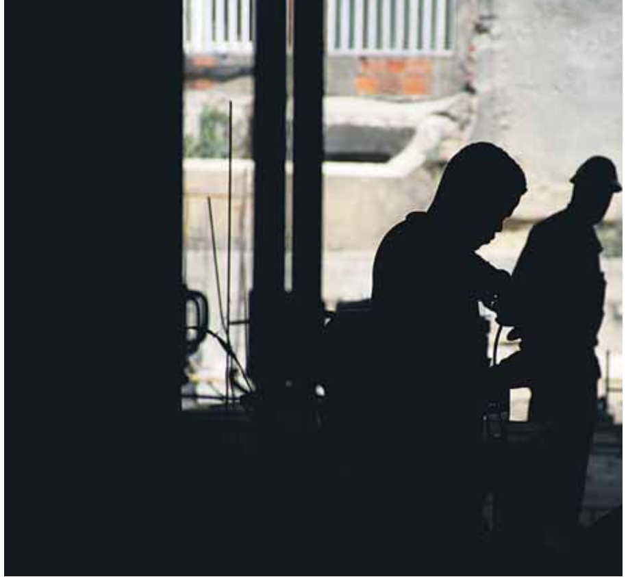
Sector da construção fez disparar desemprego nos últimos meses