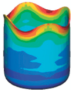
Fig. 1. Simulação numérica de taça cilíndrica; Distribuição da tensão equivalente.

O espaçamento entre título/autores/filiação/e-mail e resumo/referências: 6 pontos; o espaçamento entre e-mail/resumo: 18 pontos. O título, autores, filiações e e-mail centrados.